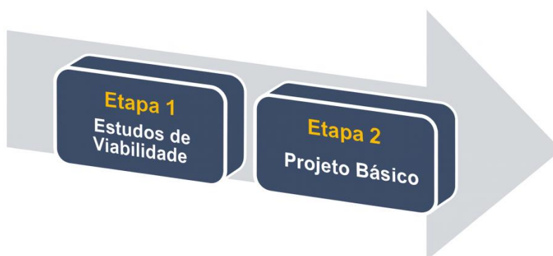
Figura: Etapas do Projeto

5.3.6 A seguir, descrevemos as Etapas dos projetos de barragens, conforme apresentado: